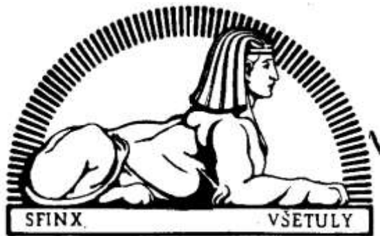
Expirovaná ochranná známka - přihláška č. 3664

Dne 17. srpna 1912 byla zaregistrována ochranná známka na výrobky továrny s motivem egyptské sfingy.